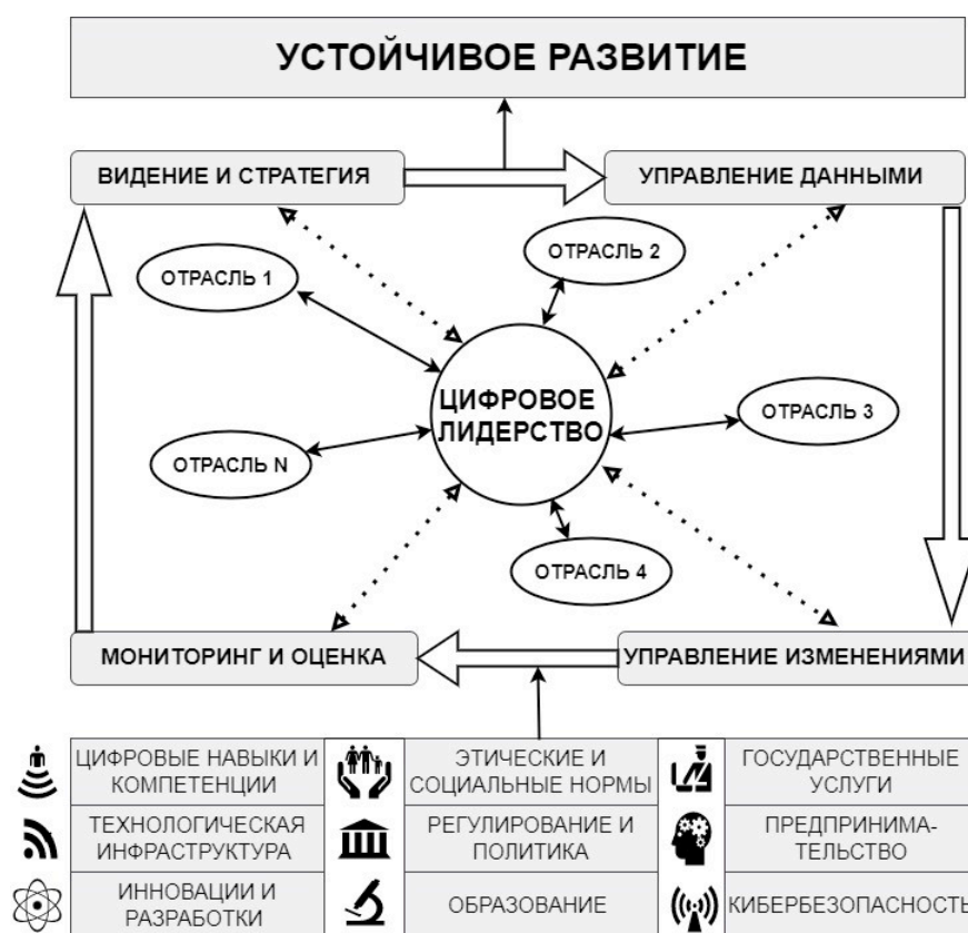
Рис. 1. Концептуальная модель цифрового лидерства